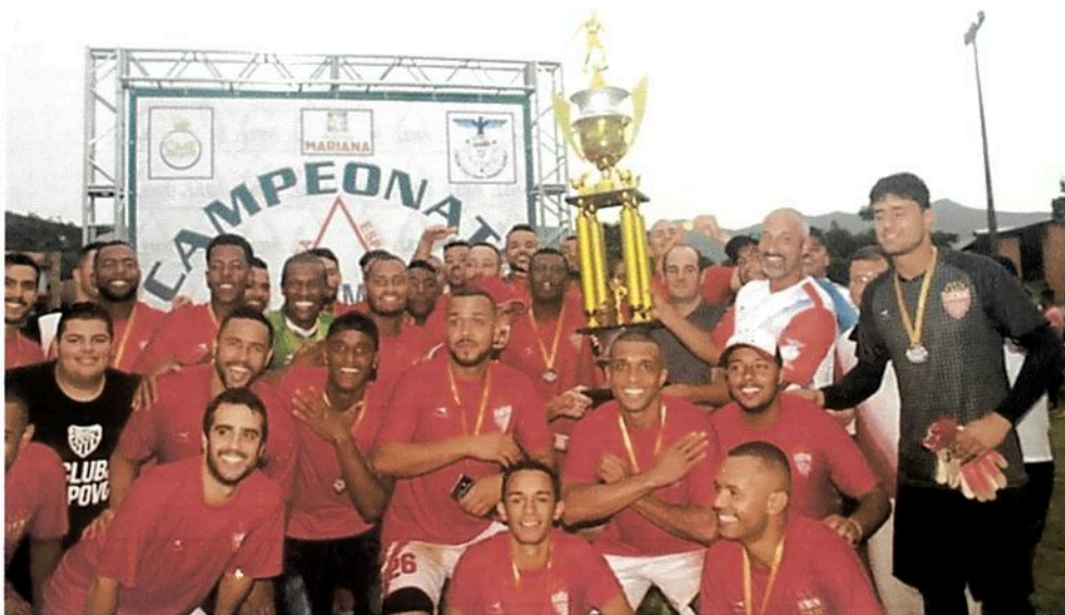
Com 8 vitórias e 4 empates, o Olympic conquistou o título do campeonato da 1ª Divisão de 2019

Com novo empate (2 x 2) contra o São Caetanense, o invicto Olympic Esporte Clube conquistou o título do Campeonato da 1ª Divisão de Mariana, nesta sexta-feira (15).